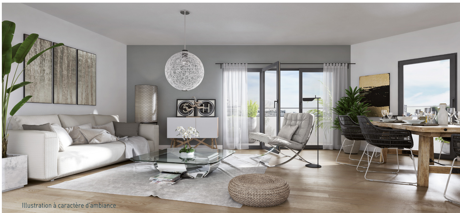
Illustration à caractère d'ambiance